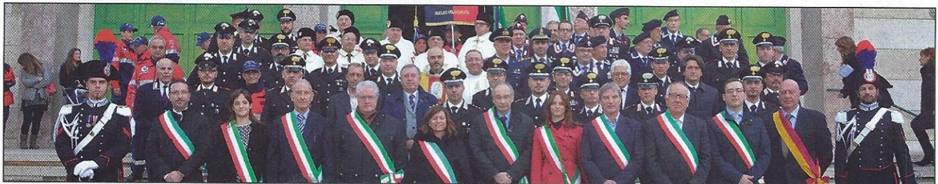
Pres. Car. Aus. P. Cicolani Sono presenti otto sindaci in occasione di recente cerimonia pubblica